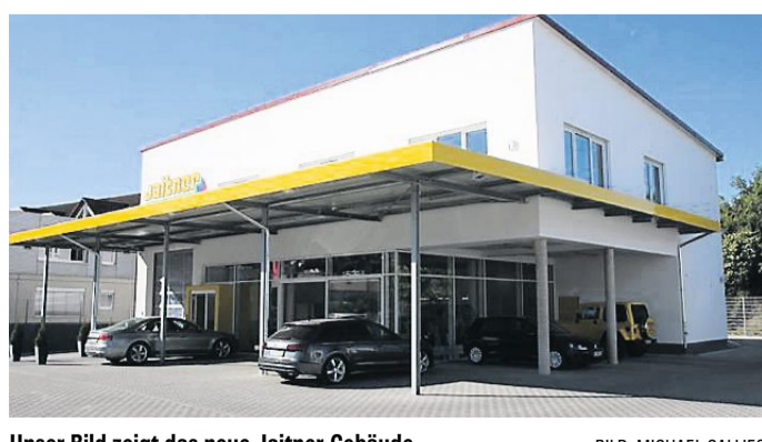
Unser Bild zeigt das neue Jaitner-Gebäude.

Euro gekostet und wurde ausnahmslos von Firmen aus der Region realisiert. „Das lag uns besonders am Herzen.“ Zukunftsweisend ist auch das riesige Vordach, das dafür sorgt, dass Kunden trockenen Fußes in den Komplex gelangen. „Wir lassen unsere Kunden doch nicht im Regen stehen“, scherzt Jaitner. Zahlreiche überdachte Parkplätze runden das Konzept ab. Nach 2000 – damals entstanden zwei neue Lackierkabinen und ein Sozialraum – hat das Unternehmen jetzt erneut in die Zukunft investiert. „Diese Investition war schon lange geplant und ist aus Platzgründen